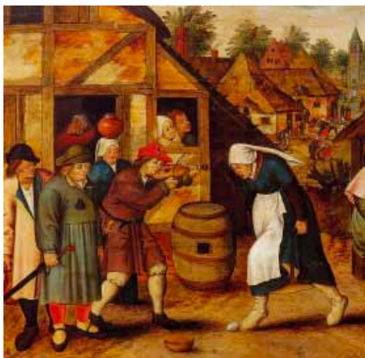
Auch Brueghel, Pieter d.J. 1564-1638 malte den "Eiertanz", schon damals ein Geschicklichkeitstanz, ein Ei unversehrt in einen Kreis zu bringen. (Ausschnitt aus dem Gemälde).

Ein Beleg dieser Redewendung findet sich 1795 in Johann Wolfgang von Goethes Wilhelm Meisters Lehrjahre. Goethe hatte zuvor einem Mädchen zugesehen, das Eier als Muster auf den Boden gelegt hatte und mit verbundenen Augen um diese herumtanzte. Das Mädchen berührte dabei kein einziges Ei. Goethe beschrieb dieses Erlebnis in seinem Werk und viele Leute lasen es. Daraus entwickelte sich dieser Ausspruch.